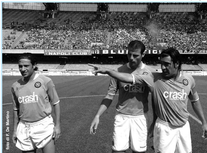
Grava, Romito e Montervino

Il difensore paraguaiano tra i migliori calciatori di Reja